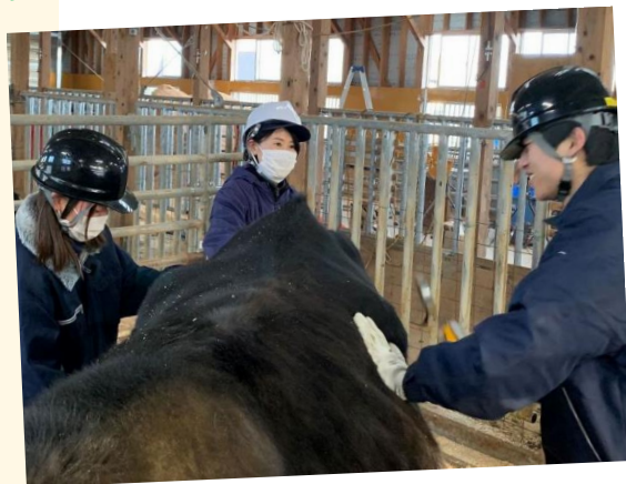
↑ 畜産実習 (牛のブラッシング) の様子

また、県内各地に配属されることも、各地域の地域性を感じることができて面白いと思います。