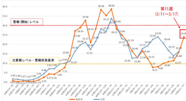
インフルエンザに係る定点当たりの報告数の推移

感染症の発生状況について ※福島県感染症発生動向調査週報 2024年第11週(3月11日～17日)より