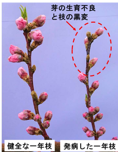
図1 春型枝病斑の特徴