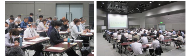
＜ セミナー会場の様子 ＞