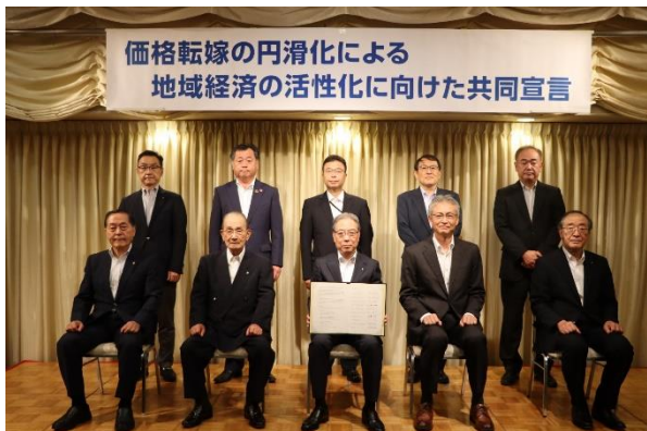
共同宣言式の様子（令和5年9月1日）

福島県では、経済団体・労働団体・行政機関の10団体の連名により、 「価格転嫁の円滑化による地域経済の活性化に向けた共同宣言」 を発出し 「適切な価格転嫁」 の機運醸成に連携して取り組んでいます。