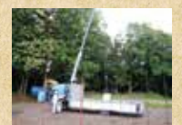
小型クレーン など