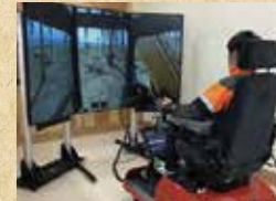
ハーベスタシミュレーター

ドローン操作、森林3次元計測システムによる森林調査、森林情報把握など、ICTを活用した先端林業技術、シミュレーターにより高性能林業機械の操作技術も学べます。