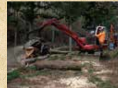
造材機械操作実習(プロセッサ)