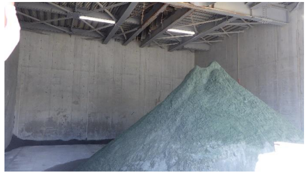
焼却施設の状況 (生成スラグ) 異常なし。