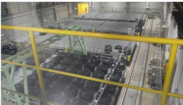
灰処理施設の状況 (廃棄物受入ヤード) 異常なし。