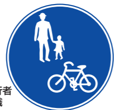
自転車及び歩行者専用を示す標識