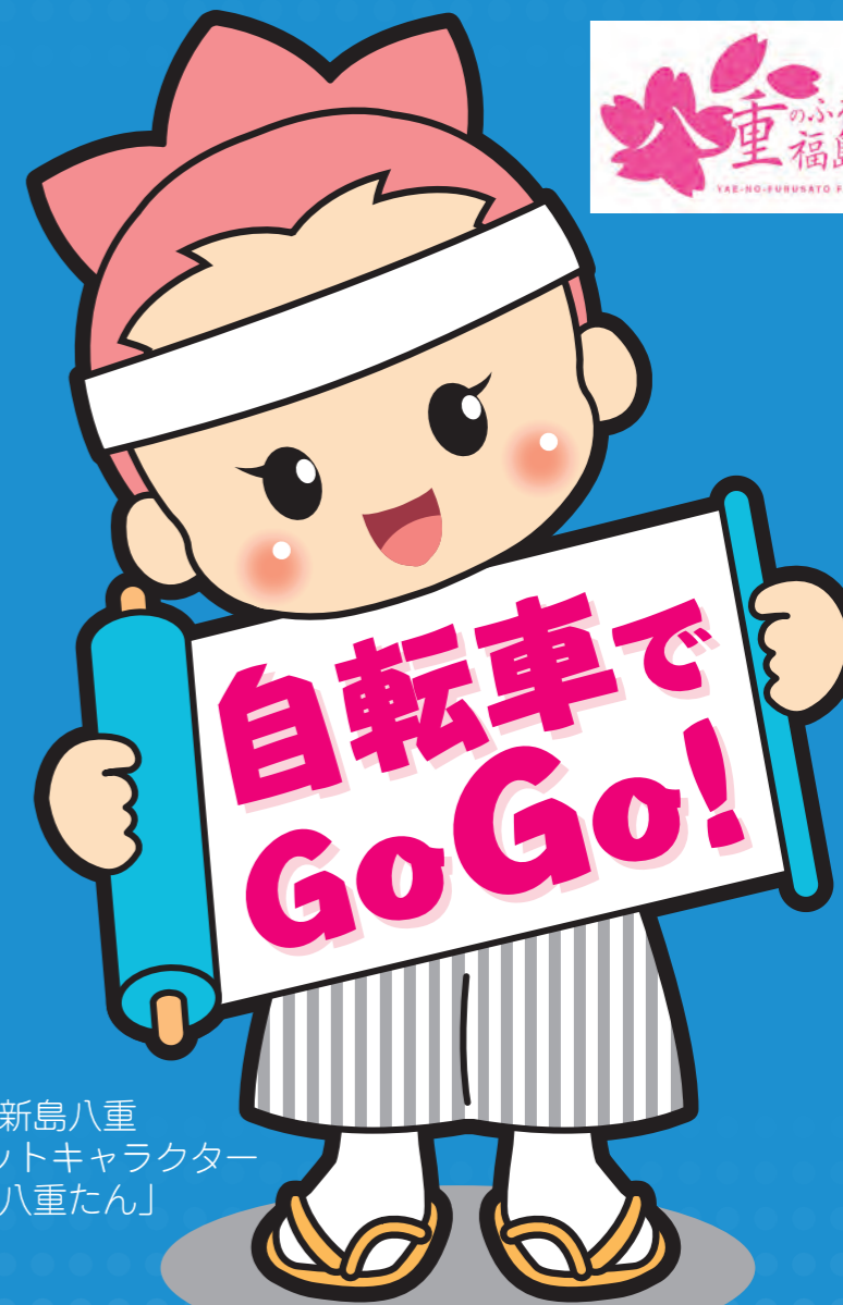
新島八重 マスコットキャラクター 「八重たん」