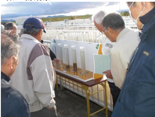
施設見学（水処理施設）