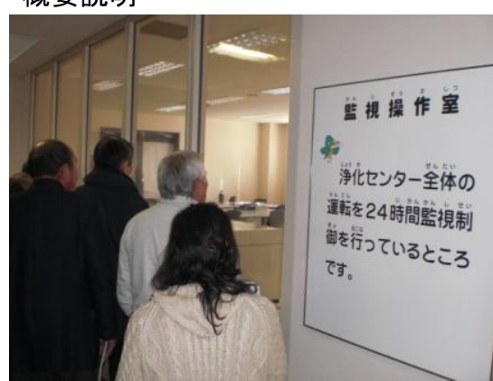
施設見学（監視操作室）