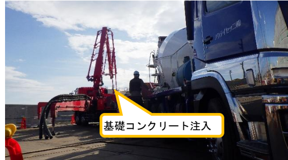
(写真 2②) 保護カバー（コンクリート部）設置工事の状況②