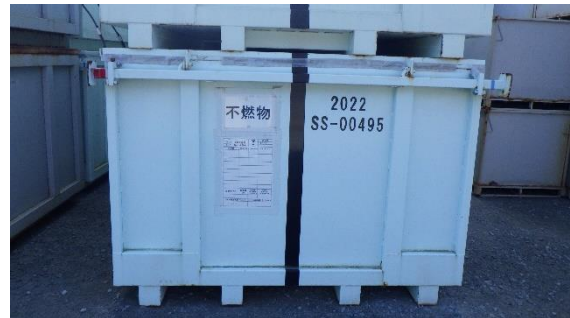
(写真 4) 一時保管用コンテナ及び保管物の表示状況