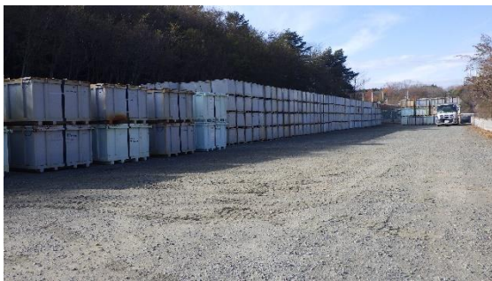
(写真 3) 瓦礫類一時保管エリア I の状況