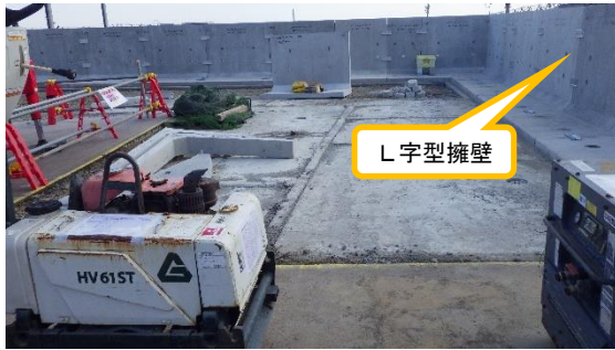
(写真 2①) 保護カバー（コンクリート部）設置工事の状況①