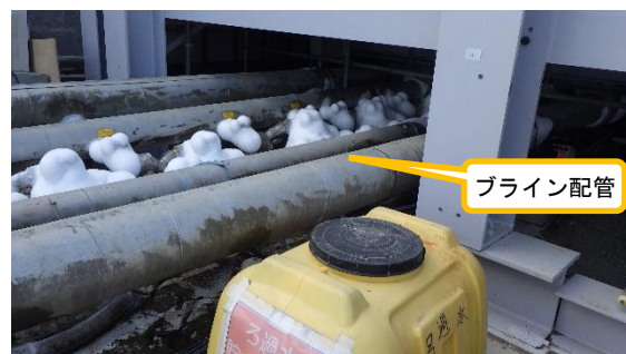
（写真1②） 鋼製保護カバー設置工事の状況②