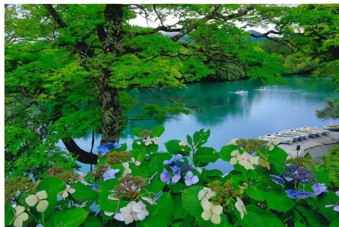
毘沙門沼(猪苗代湖・裏磐梯湖沼フォトコンテスト入賞作品)