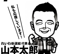
れいわ新選組 代表 山本太郎