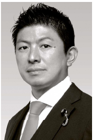
参政党代表・神谷宗幣