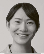
党首・AIエンジニア あんの 安野貴博 35歳 参議院議員