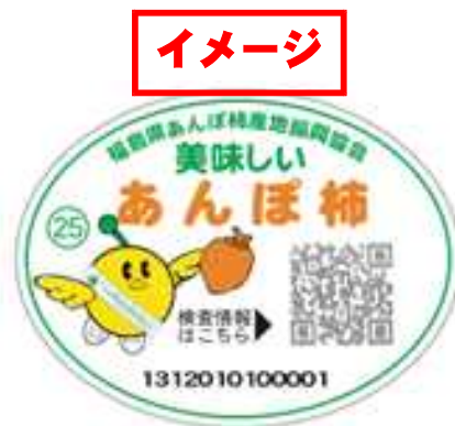
図2 検査済みシール