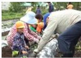
園児による農業体験

キャベツ、タマネギ、白菜等の野菜を、今回解消した農地をフル活用して生産します。 また、耕作している農地に隣接する「おもて「二つ保育園」の園児と地元「高砂老人クラブ」の交流の場として農園を提供することで食育と生きがいづくりに寄与できればと考えています。更に、解消農地での野菜栽培に障がい者の方々の働く場としての提供を視野に、地域と共存できる会社として営農活動を実践していきたいと思えます。