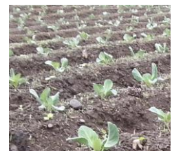
再生農地でのキャベツ栽培

平成25年10月、農業生産法人として白河市表郷地区に会社を設立しました。昨年の春から作物生産をする農地の利用権設定のため、表郷地区の農地を探したのですが、優良な農地を借りるのは、容易ではなく、まずは、農家が手の回らない耕作放棄地の活用を考え、今回、耕作放棄地再生に取り組んだところです。