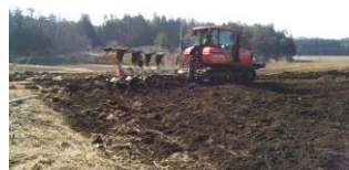
大型機械による反転作業

協力企業の大型機械を活用し、背丈ほど伸びた草をトラクターに取り付けたモーター刈り取り、成長した雑木類はノコギリで伐採し、抜根作業を行いました。 農地は、プラウで反転し、ロータリーで耕耘した後、レーザーレベラーで均平作業を行い、野菜の植え付け・管理・収穫等の作業全般に適した農地に仕上げました。解消した大切な農地はしっかりと活用していきます。