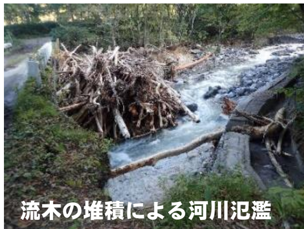
流木の堆積による河川氾濫