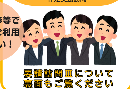
要請訪問Ⅱについて 裏面もご覧ください

今年度も、各種研修会の様子や事業の成果を、「学校教育課だより」や「広報南会」等でお届けします。実践の充実にお役立てください。