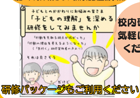
研修パッケージもご利用ください