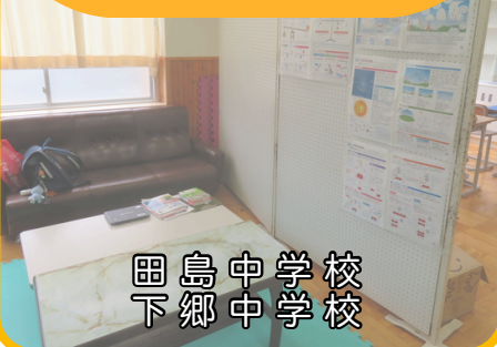
田島中学校 下郷中学校