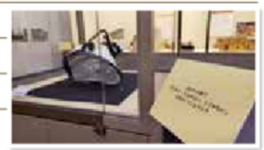
落下した体育館の照明

本展は、いづくで起きても不思議ではない災害への「そなえ」について、大切な人と考えるきっかけとなることを目指します。今までに収集した震災遺産から、東日本大震災を知らない世代の皆さんも「ふくしまの経験」を知り、「未来のふくしま」について考えてみませんか。