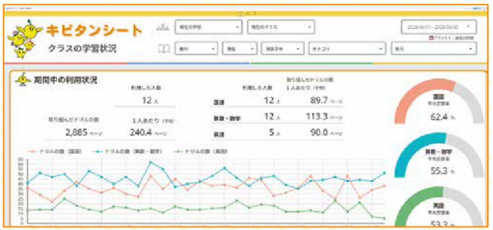
ダッシュボードのサンプル