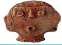
縄文時代の土偶 (南相馬市天神谷地遺跡)