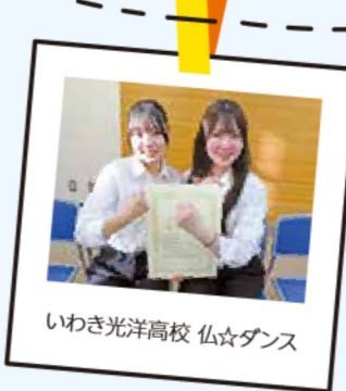
いわき光洋高校 仏☆ダンス