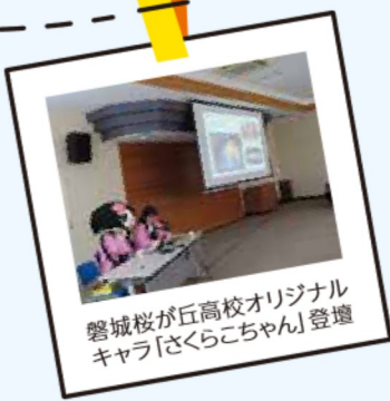
磐城桜が丘高校オリジナルキャラ「さくらこちゃん」登壇