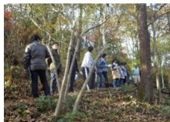
《これまでの活動の様子》