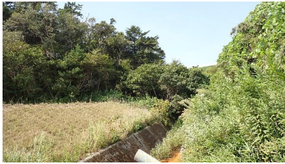
(写真4①) エリア東側の前回確認時の状況 (令和7年9月1日撮影)