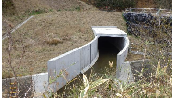
(写真3) 下流域に整備された水路