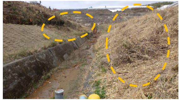
(写真4②) エリア東側の今回確認時の状況 ※黄棒が伐採箇所