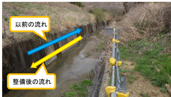
(写真1②) 陳場沢川整備後の流れ②