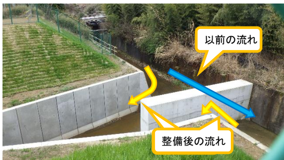
(写真1①) 陳場沢川整備後の流れ①