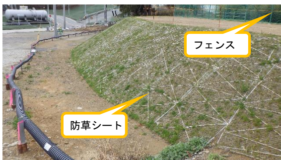
(写真2) 整備工事箇所の状況