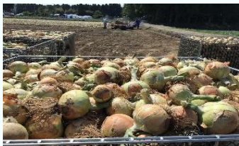
タマネギの作付再開 (高岡町)

地域の営農再開の進捗に応じて、農地の保全管理や地力回復、農業用機械の導入支援等により、営農再開が進展。