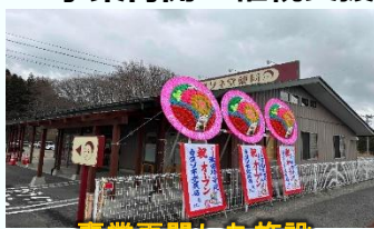
事業再開した施設 (田村市)

被災事業者の事業継続・事業再開を支援し、事業・生業の再建等の支援によるまち機能の回復を促進