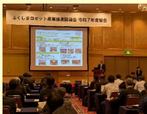
ふくしまロボット産業推進協議会

ロボット関連産業の集積と取組の拡大を目的に設立されたふくしまロボット産業推進協議会の活動を通じて、県内企業の参入支援や関係機関等とのネットワーク構築に取り組む。