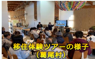
移住体験ツアーの様子 (葛尾村)

ふくしま12市町村移住支援センターが中心となって市町村と連携し、戦略的な情報発信による地域の認知向上、移住セミナーや移住体験ツアーなどによる移住希望者の呼び込み、各種支援金の交付など、12市町村の移住促進に向けた広域的な取組を実施。