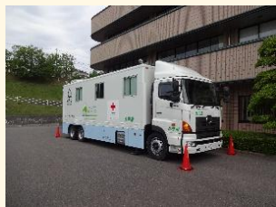
ホールボディ・カウンターによる 内部被ばく検査

ホールボディ・カウンターによる内部被ばく検査を実施。平成24年3月以降の結果は全て1 mSv未満（健康に影響が及ぶ数値ではない）。