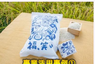
事業活用事例① 米 (福、笑)