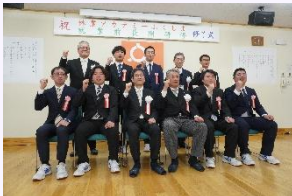
林業アカデミーふくしま 修了式

地域林業の核となる担い手を育成するため、技能講習や安全衛生教育等の林業に関する研修を「林業アカデミーふくしま」において実施。1年間の就業前長期研修を修了した研修生が県内の林業事業体に就職。