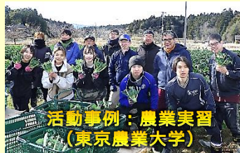
活動事例：農業実習 (東京農業大学)

イノベ地域での人材育成基盤の構築を目指し、大学等の教育研究を活用した福島復興に資する知(復興知)を集積するとともに、自治体や地域企業等と連携した特色のある教育研究プログラムの開発や実践など、それぞれの大学等の教育研究活動を支援。