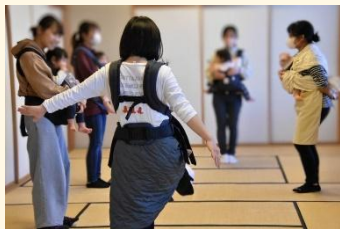
子育てサロンの様子