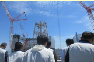
廃炉スタディツアー

元請企業と県内企業のマッチング支援のほか、交流会・廃炉スタディツアー、福島廃炉産業ビジネス総合展の開催。