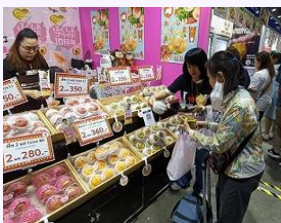
タイでの 展示会への出展

海外を新たな市場と見据え、農産物輸出の定着化を図るとともに、県産品の販路拡大を行い、現地で県産品を身近に感じていただきながら、本県の風評払拭を図る。