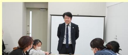
F-REIと地域との連携モデル創出事業 (おしごと図鑑をつくらう! 水素タウン編)

F-REIの研究内容や浜通り地域に進出した企業のニーズ等について、中通りや会津地方の企業や大学等に紹介するセミナーを開催した。また、F-REIの研究者を講師とした人材育成塾や科学教室など、F-REIと地域の多様な主体との様々な連携の構築に向けた取組を実施した。