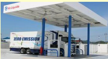
本宮インターチェンジ 水素ステーション

水素社会の実現に向け、水素モビリティの導入に対する支援等を実施。 また、県内工場等における水素の利活用を促進するとともに、福島大学水素エネルギー総合研究所が県内企業等と連携して行う研究開発・人材育成の取組を支援。