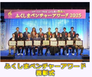
ふくしまベンチャーアワード表彰式

優れたビジネスプランの表彰や新規プロジェクトの立ち上げ支援、創業経費の一部補助と伴走支援を実施。