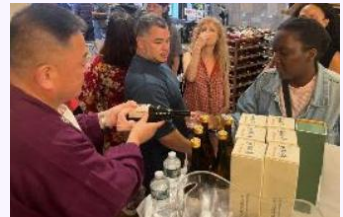
ふくしまの酒専用コーナー設置店舗での試飲販売会

国内外の品評会で高い評価を受けている「ふくしまの酒」等の魅力ある県産品の認知度向上及び販路拡大を実施。