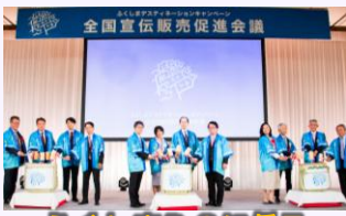
ふくしまDCに係る観光PR会議

首都圏の旅行会社等を対象に、本件の観光の魅力をPRし旅行商品造成につなげ誘客促進を図る商談会を実施。