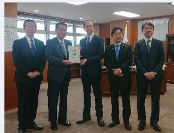
省庁等への要望活動

特定帰還居住区域の除染や双葉地域における中核的病院の整備、地域産業の再生に要する経費のほか、福島再生加速化交付金や震災復興特別交付税などを計上。