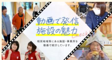
介護施設の魅力発信動画

妊婦や乳幼児を持つ保護者を対象に電話相談やオンラインでの相談、家庭訪問、子育てサロン、母乳の放射線検査などを実施。被災地における福祉・介護人材の確保のための広報活動などを実施。