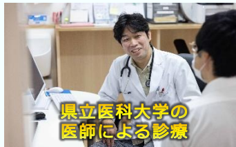
県立医科大学の 医師による診療