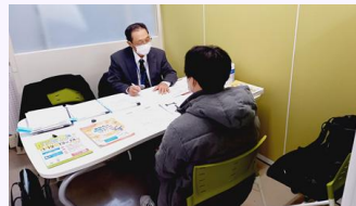
ふくしま生活・就職応援センター 面接会

各地に設置した就職相談窓口を通じて県内就職希望者の就職支援を行うとともに、県内企業の魅力を広く情報発信。