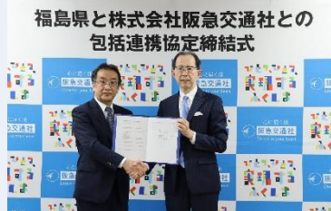
包括連携協定の締結式

新たに包括連携協定を締結するとともに、県政情報の発信や県産農産物を使ったメニューの社内食堂での提供、県産品PRイベントの開催支援など、協定締結企業等との相互の連携強化の取組を実施。