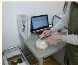
児童福祉施設等の 給食検査

児童福祉施設等の給食用食材について、より一層の安全・安心を確保するため、希望する施設において放射線量測定検査を実施。児童生徒が自分自身の健康課題に積極的に取り組むことができる自己マネジメント能力を育成。