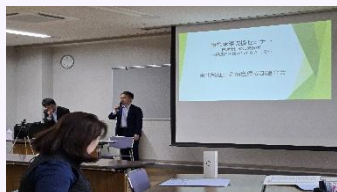
事業承継税制セミナー

商工団体、関係機関等と連携しながら、事業承継計画策定から実施までの伴走支援等を実施。