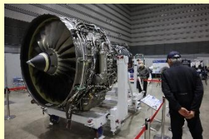
航空宇宙フェスタふくしま

航空宇宙産業の普及啓発、取引拡大を促進するため、展示会「航空宇宙フェスタふくしま」を開催。