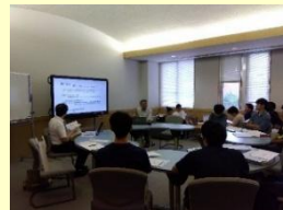
ICTに係る勉強会の様子

県内大学等への起業意欲の醸成から候補者の発掘、事業化支援までの一連の支援を行うことで、県内大学発ベンチャーの創出を目指す。