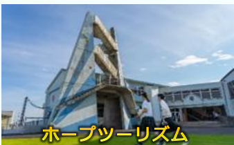
ホープツーリズム

福島ならではの学びが実現できるホープツーリズムの推進のため、人材育成及び教育旅行・企業研修プログラムの磨き上げや、旅行会社や学校等からのワンストップ窓口及びサポートセンターの運営等を実施。