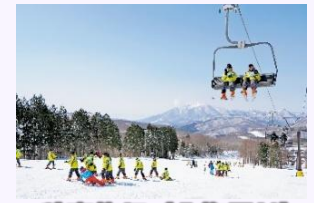
教育旅行 (北塩原村)

教育旅行の誘致拡大に向け、引き続き震災の経験を踏まえた防災教育や、新たな素材を活用した体験プログラムづくりの磨き上げやモニターツアー等を実施。