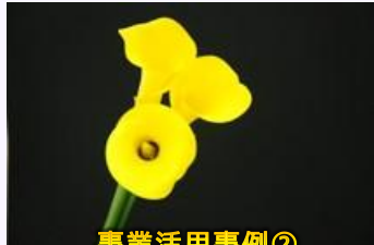
事業活用事例② カラー (キビタンイエロー)

県産農林産物のブランド力の向上や風評払拭を図るため、品種登録出願について、出願料及び登録料の4分の3に相当する額が軽減される。