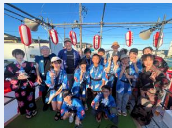
中之作プロジェクト ほんおどり

行政では手の届きにくいきめ細かな復興・被災者支援の取組を推進し、本県のきずなの維持・再生を図るため、被災者の心のケア・健康・生活支援、被災地域のコミュニティ再生や課題解決、風評払拭等に取り組むNPO法人等を支援。