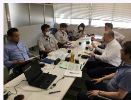
専門家による支援

事業戦略、知財戦略など総合的開発戦略を行う専門機関によって、企業の特性に合った支援メンバーの編成を行い、県内企業の研究開発に対して、総合的な事業戦略・知財戦略構築の支援を実施。