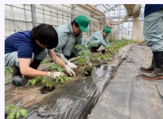
アグリカレッジ福島 における実践的な研修

本県の主要な産業である農業の成長産業化を図るため、多様な担い手の確保に向け、県内外でのPRや就農相談会の開催、地域農業の実情に即した新規就農者の受入体制の整備、雇用就農を促進するための実践研修を行うとともに、青年農業者の育成を図ること等により、新規就農者の確保を促進。