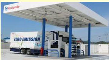
本宮インターチェンジ 水素ステーション

水素社会の実現に向け、水素モビリティの導入に対する支援等を実施。 また、県内工場等における水素の利活用を促進するとともに、福島大学水素エネルギー総合研究所が県内企業等と連携して行う研究開発・人材育成の取組を支援。