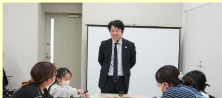
F-REIと地域との連携モデル創出事業 (おしごと図鑑をつくらう! 水素タウン編)

F-REIの研究内容や浜通り地域に進出した企業のニーズ等について、中通りや会津地方の企業や大学等に紹介するセミナーを開催した。また、F-REIの研究者を講師とした人材育成塾や科学教室など、F-REIと地域の多様な主体との様々な連携の構築に向けた取組を実施した。