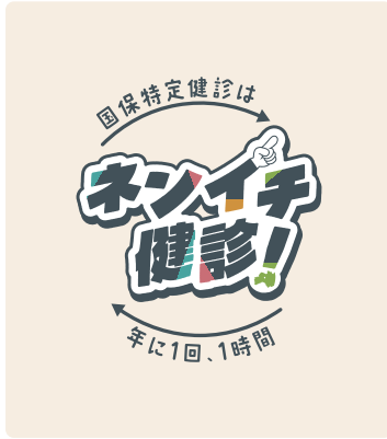
指定色(フルカラー)