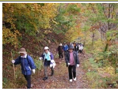
ウォーキングによる地域交流