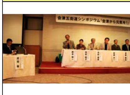
会津五街道の連携