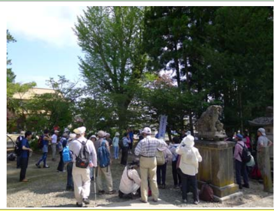
会津五街道ウォーク