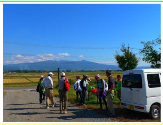
H24会津まほろば街道サイクリング大会