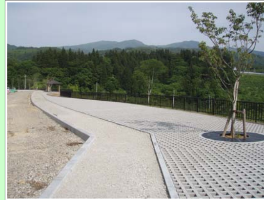
施工中(平成26年度完成予定)