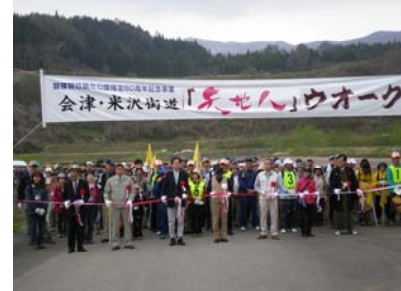
NHK大河ドラマ「天地人」