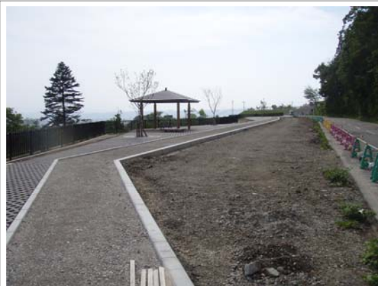
施工中(平成26年度完成予定)