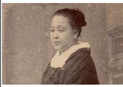
NHK大河ドラマ「八重の桜」