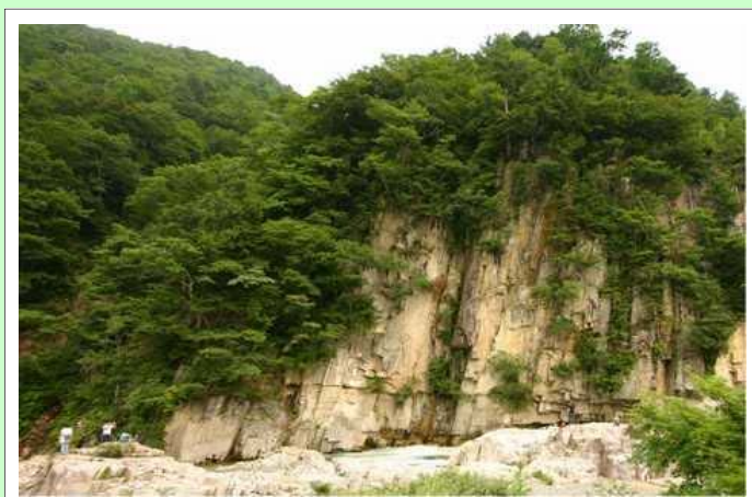
視点場からの眺望