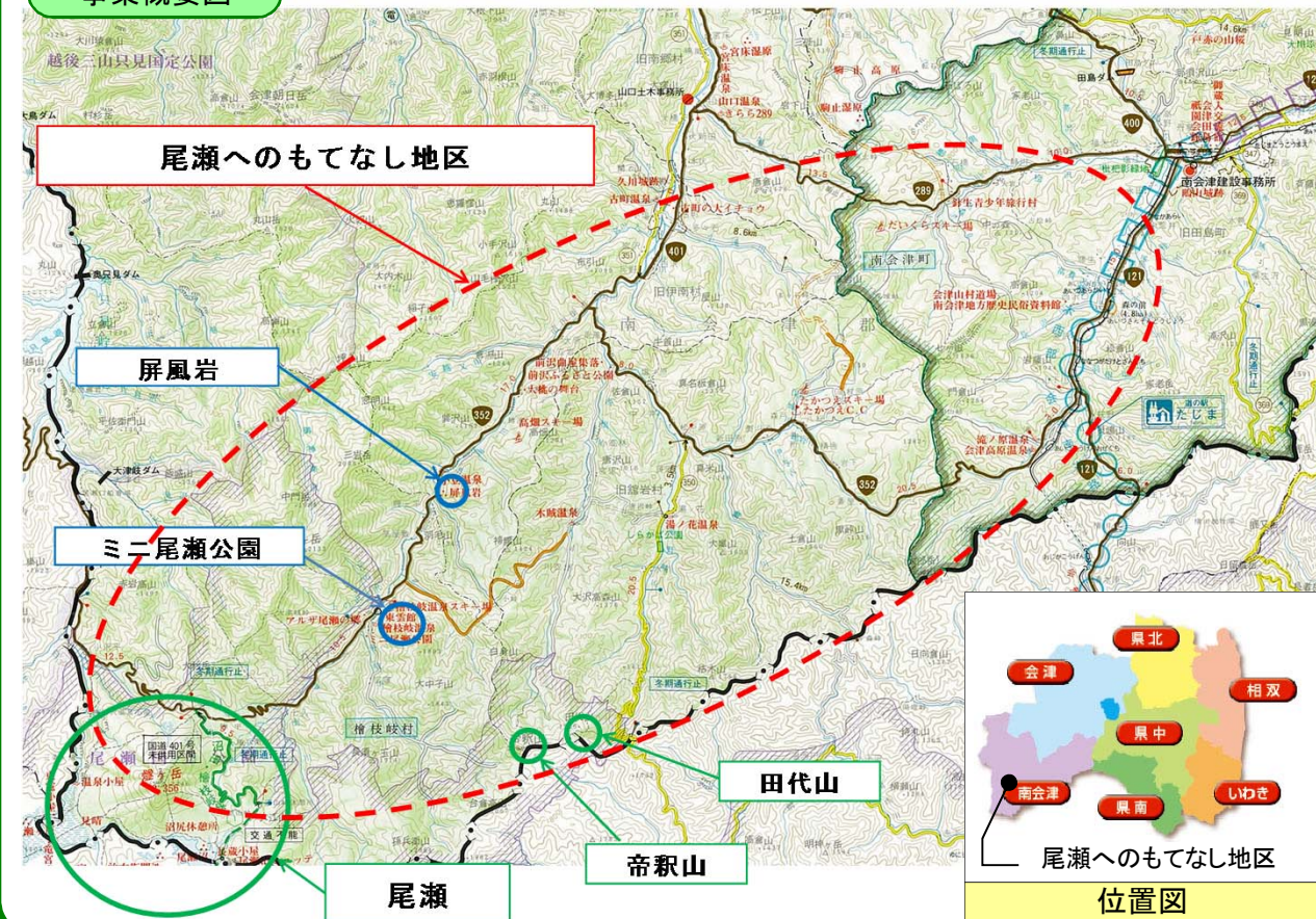
尾瀬へのもてなし地区 位置図