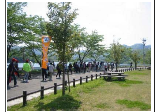
ウォーキングイベント