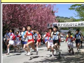
はやま湖マラソン大会