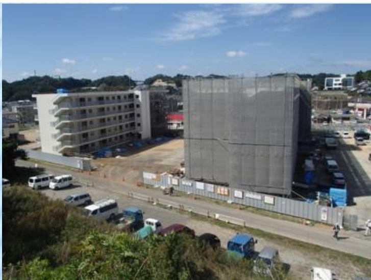
下神白団地1・2号棟（小名浜地区）