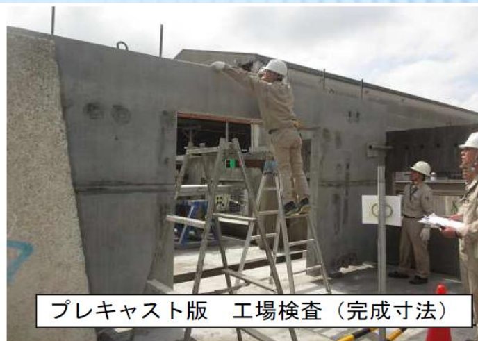
プレキャスト版 工場検査（完成寸法）