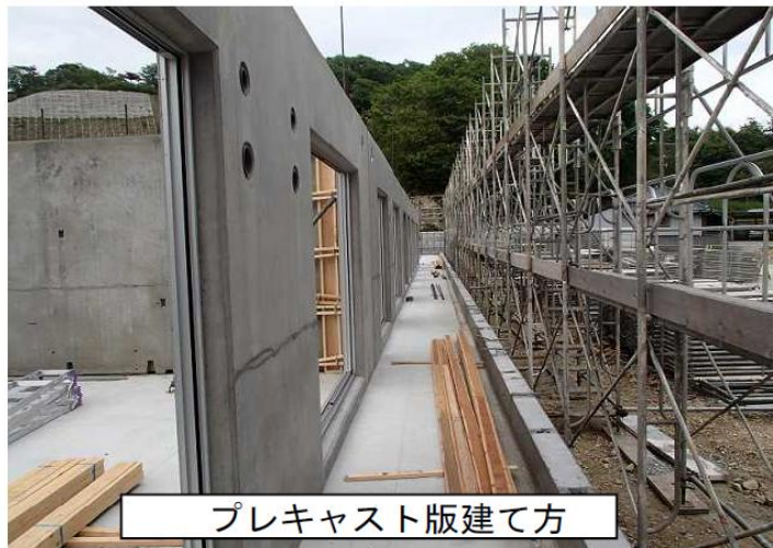
プレキャスト版建て方