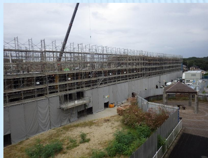
湯長谷団地24号棟（常磐地区）