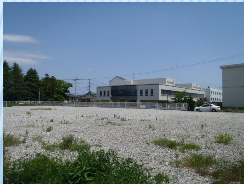
八幡小路団地（平地区）