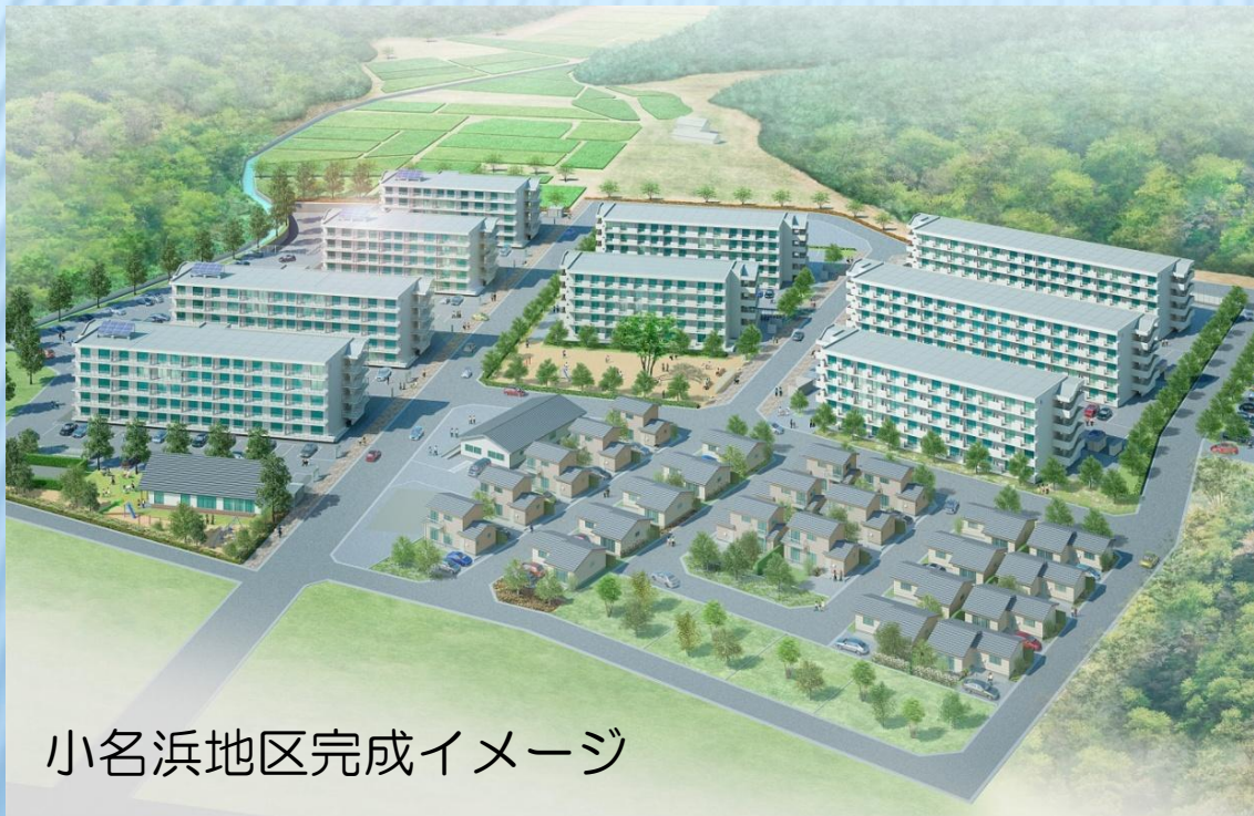
小名浜地区完成イメージ