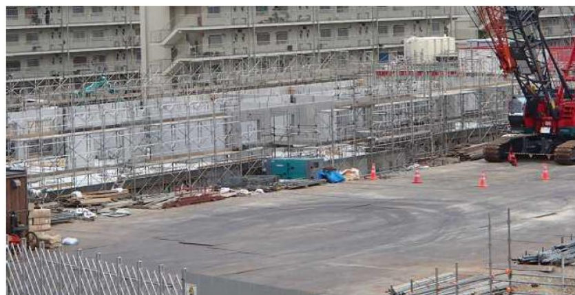
プレキャスト版建て方遠景