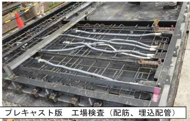
プレキャスト版 工場検査（配筋、埋込配管）

現場での地下の基礎製作と並行して、地上の住戸部分を工場で製作するため大幅な工期短縮と人手不足が解消され、平成26年度内の完成が可能になった。