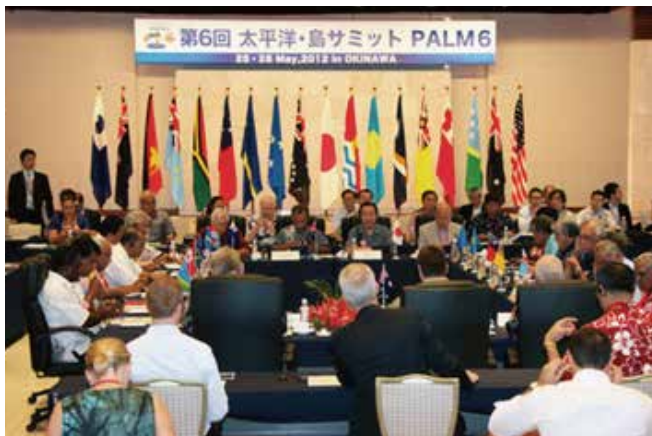
前回(第6回)サミットの様子

太平洋・島サミットは、日本と太平洋島しょ国・地域の首脳(大統領や首相など)たちが3年に1度日本に集まり、これらの国々・地域が直面するさまざまな問題について話し合う国際会議です。