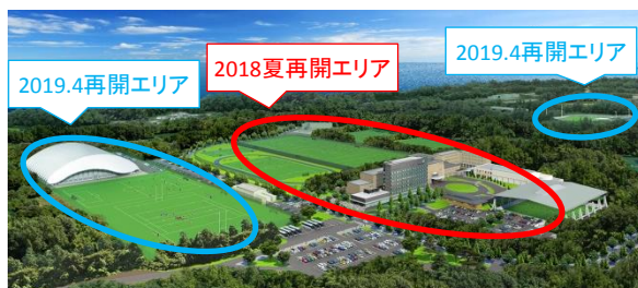
【新生Jヴィレッジの姿】