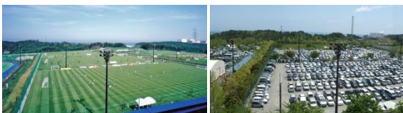
【震災前のJヴィレッジ】