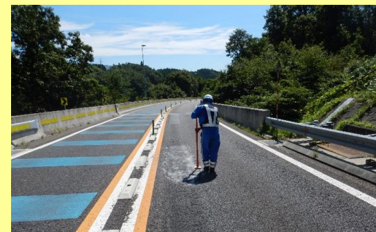
停車している道路パトロール車や作業員を見たら減速して作業にご協力をお願いします。