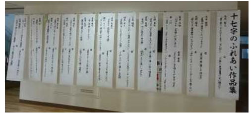
【校舎内への掲示：白河中央中】

この事業は、共通の体験をもとに、子どもと大人がそれぞれの立場からの思いを十七字で表現することで、子どもの豊かな心を育成するとともに、人と人との絆を深め、ひいては家庭や地域の教育力の向上に資することを目的としています。各学校や幼稚園では、この趣旨を十分に理解し、応募作品の校舎内への掲示、子どもたちや保護者にお便り等で作品の紹介、全校集会での趣旨説明、終業式で学校賞の伝達と子どもへの称賛など、この事業を教育活動にもうま取り入れていただいています。次年度以降も、この事業へのご理解とご協力をよろしくお願い申し上げます。