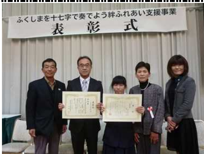
中島中学校【県最優秀賞：学校賞】