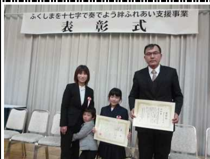
社川小学校【県優秀賞：学校賞】