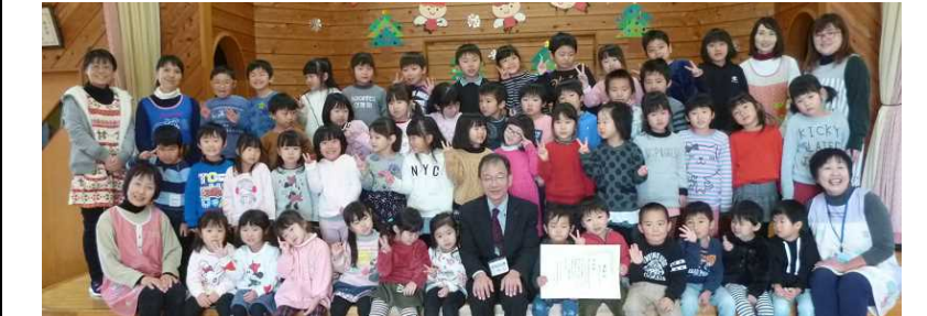
近津幼稚園【学校賞：幼稚園最高応募率】