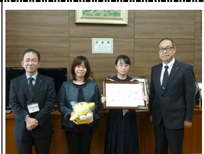
白河中央中学校【県優秀賞】