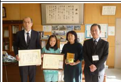
泉崎第二小学校【県佳作：学校賞】