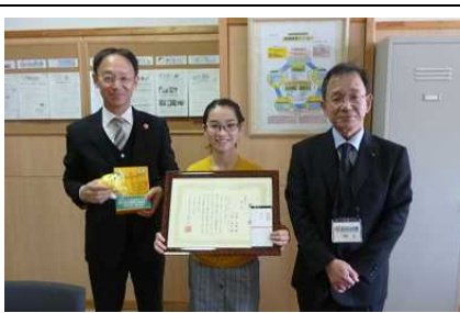
白河第二小学校【県佳作】