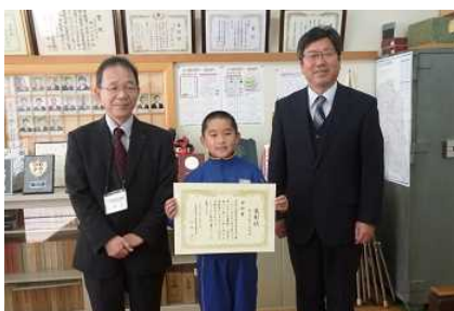
鮫川小学校【学校賞：小学校最高応募率】