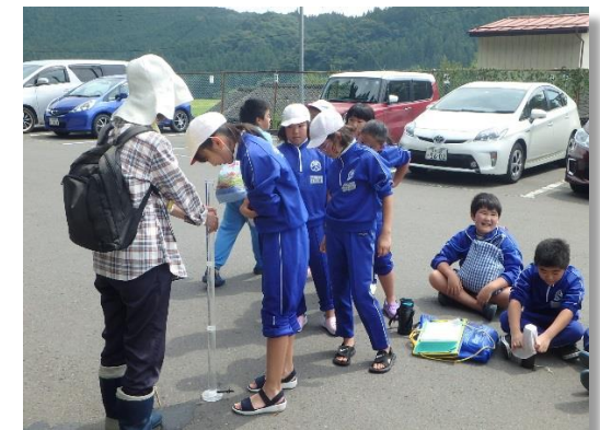
水の透視度を調査