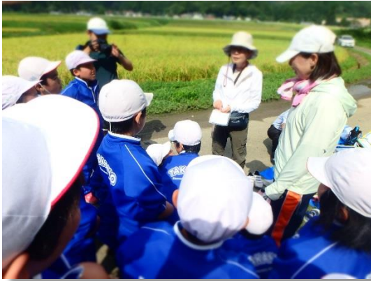
パックテストで色の変化を確認