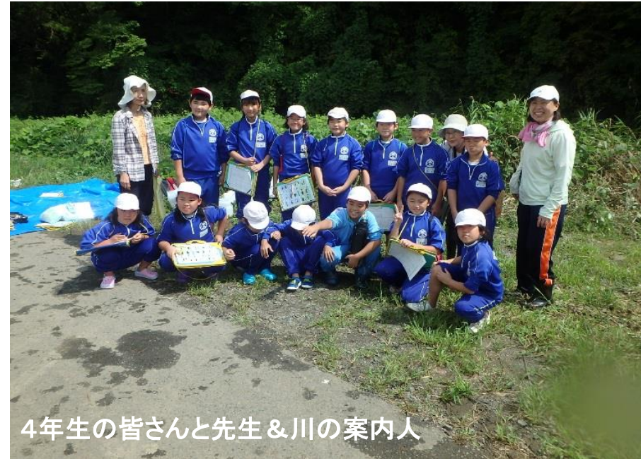
4年生の皆さんと先生&川の案内人