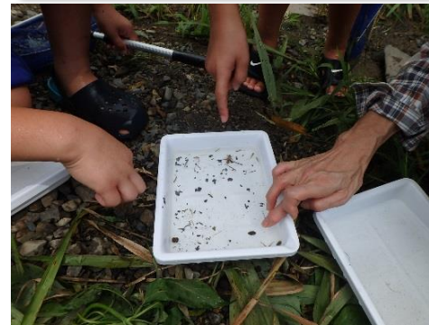
絶滅危惧種のおオタガメも発見