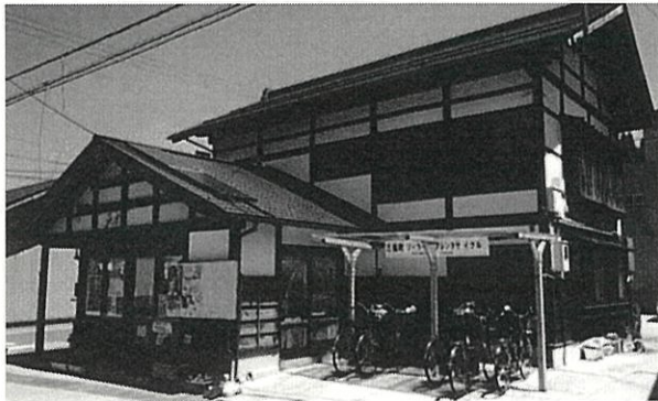
三島町観光交流館「からんころん」