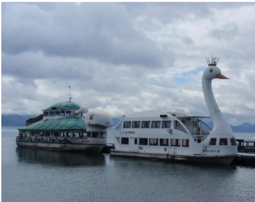
長浜棧橋に接岸中の観光遊覧船