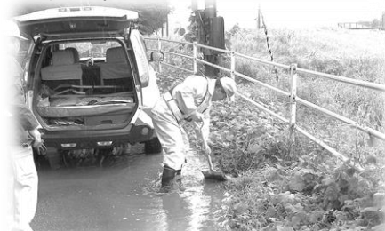
道路補修作業の様子