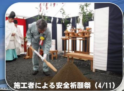
施工者による安全祈願祭（4/11）