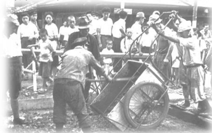
須賀川市内における舗装工事の様子