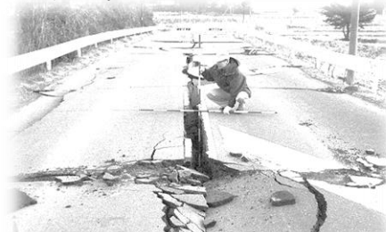
東日本大震災における道路被災状況