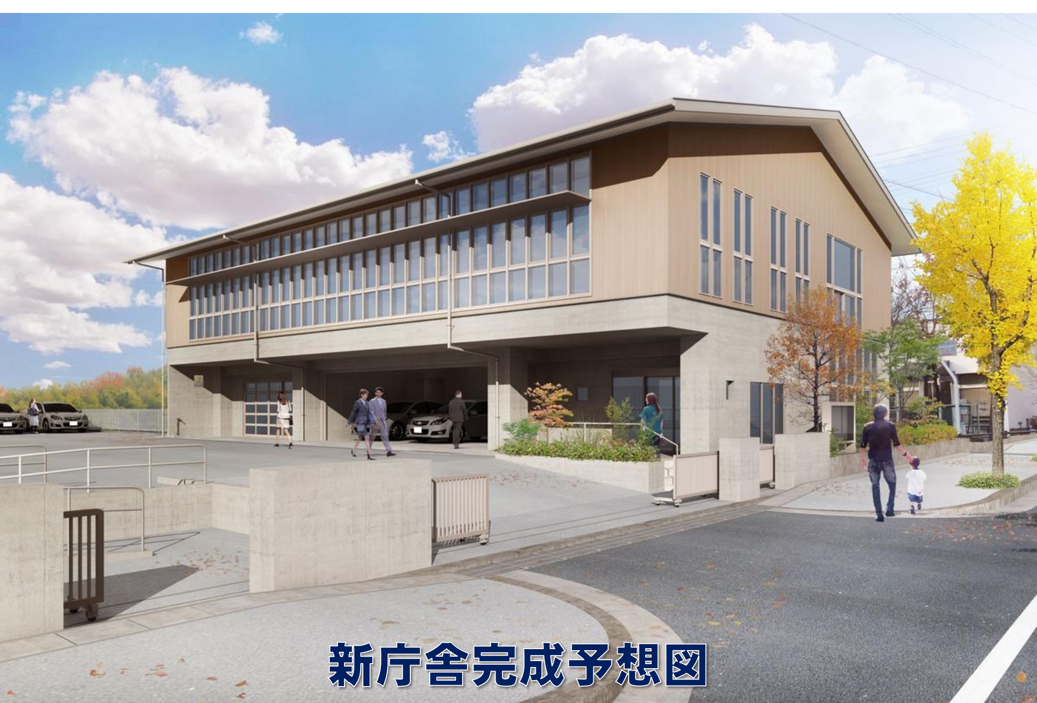
新庁舎完成予想図