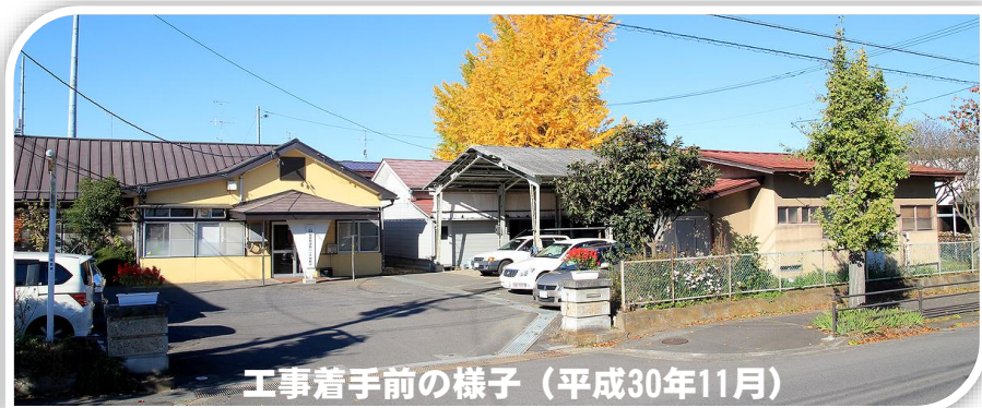
工事着手前の様子（平成30年11月）

現庁舎では昭和27年から業務を行っており、当時から変わらぬ建物・佇まいで今に至っています。しかし、現在の建物は昭和16年頃に建てられたもので、既に築70年を超え老朽化してきていることから、耐震性を有した庁舎への建替え計画を進めています。