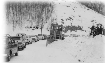
道路除雪作業の様子