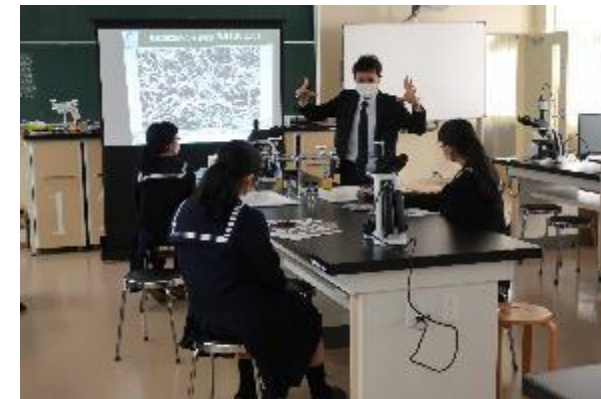
原町高校×福島大学 (出前講座)