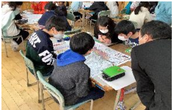
西田学園×日本大学 (防災教育)* ふくしまSSSと“復興知”の連携