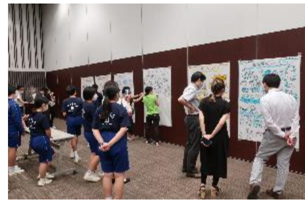
平第三中学校×東京大学 (再エネ出前授業・ワークショップ)