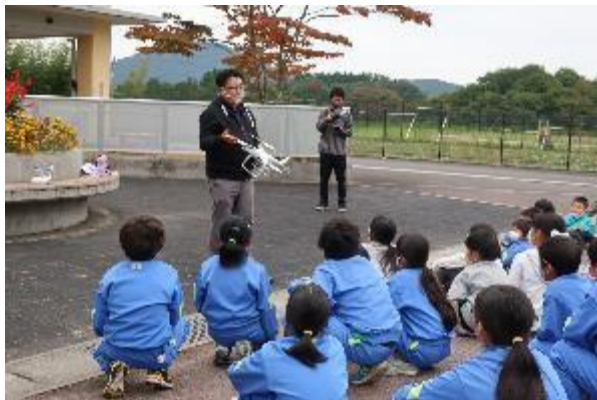
芦沢小学校×慶応義塾大学 (ドローン×プログラミング講座)