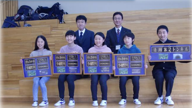
休石3号橋、逢瀬第2トンネル 郡山市立湖南小中学校 小学生4名、 中学生1名