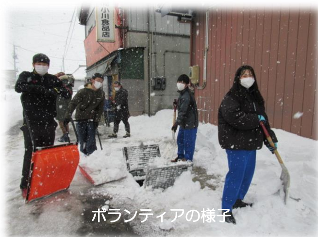
ボランティアの様子