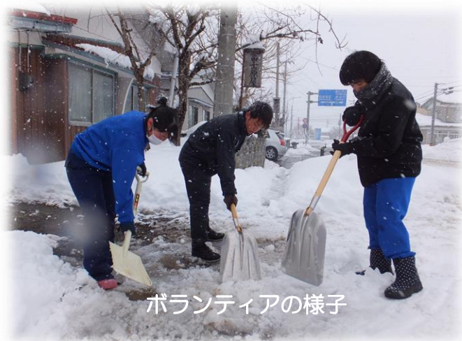
ボランティアの様子

ボランティアで雪かきを行ったのは、湖南高校の1、2年生35人。当高校では、高齢化が進む地域のお年寄りをサポートするため、1982年からこの活動を行っています。