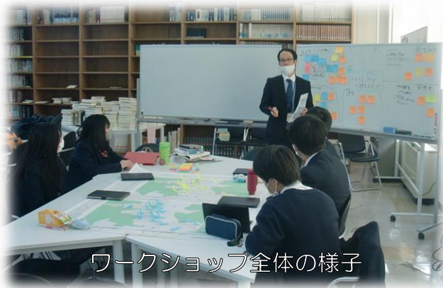
ワークショップ全体の様子

郡山市湖南町福良地区について、国道294号バイパス整備に伴う、地区市街地の空洞化が懸念されることから、バイパス完成後も街中に寄ってもらえるような観光マップづくりを行いました。引き続き、地域住民の皆様をはじめ、湖南高校や関係団体と連携し、より良い地域づくりを進めてまいります。