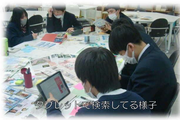
タブレットで検索してる様子