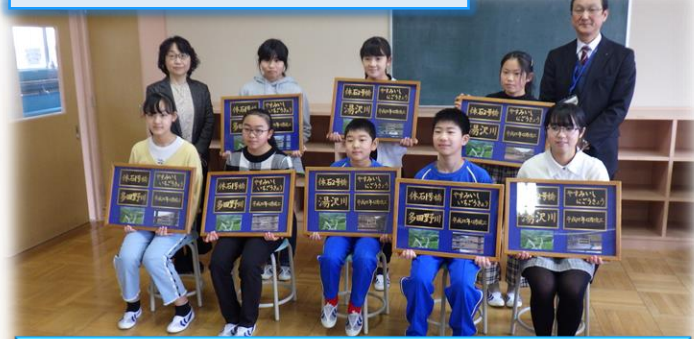
休石1号橋、休石2号橋 郡山市立多田野小学校 小学生8名