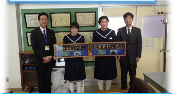
逢瀬第1トンネル 郡山市立逢瀬中学校 中学生2名