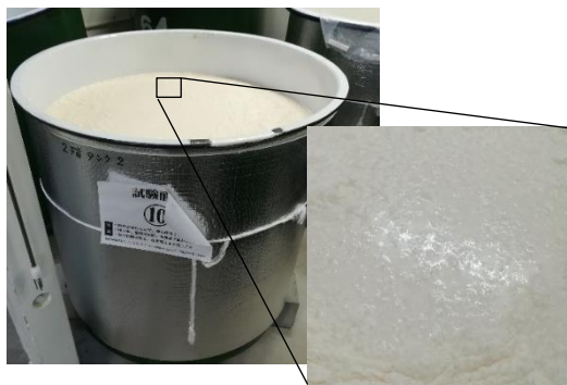
図1 応募企業における実規模試験