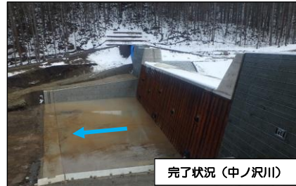
完了状況（中ノ沢川）