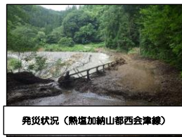
発災状況（熊鷹加納山都西会津線）