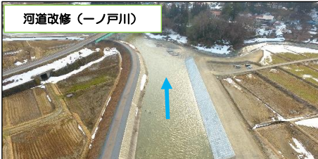
河道改修（一ノ戸川）

●河川の改修や河川に堆積した土砂の撤去、堤防補強等により浸水対策を進めています。