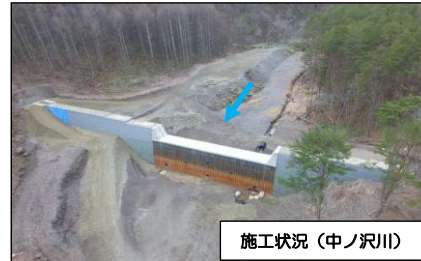
施工状況（中ノ沢川）