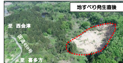
地すべり発生直後

●令和元年5月に地すべりが発生した喜多方市藤沢地区で地すべり対策工事を進めています。