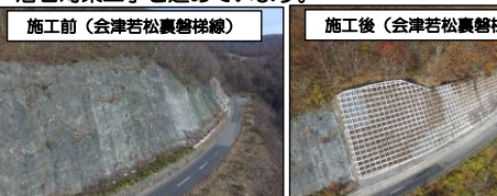
施工前（会津若松裏磐梯線）