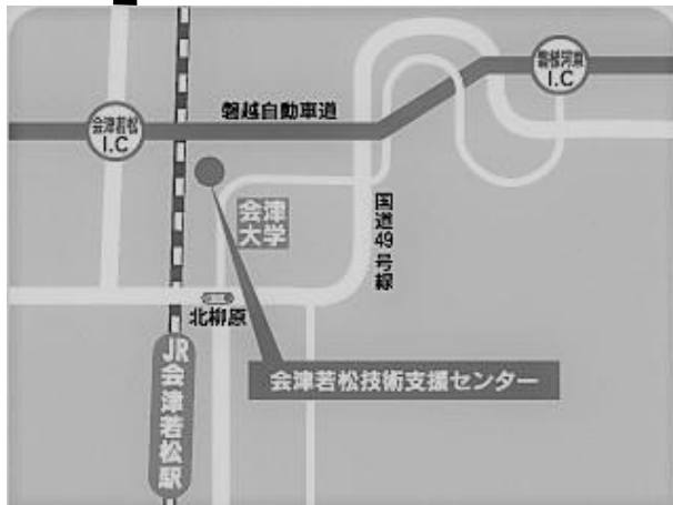
【会津若松技術支援センター】