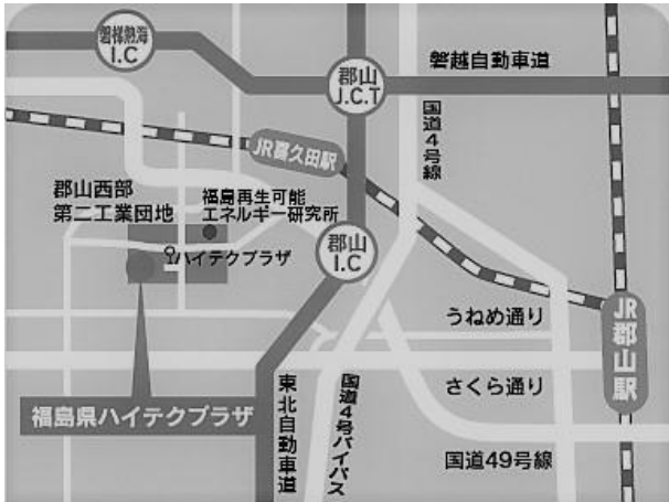
【福島県ハイテクプラザ】