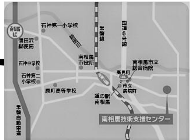
【南相馬技術支援センター】