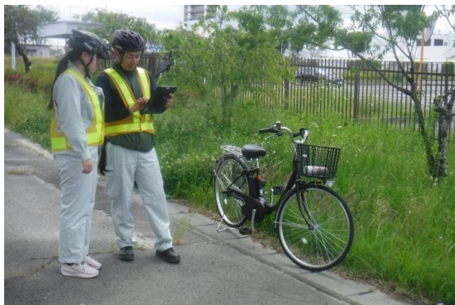
歩道パトロール中

パトロールでは、街路樹の根の成長によって発生する歩道の凸凹や亀裂などの異常を確認し、歩行者の皆様が安全に通行できるよう点検を行っています。