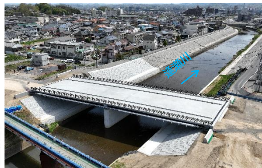
咲田橋架替工事状況