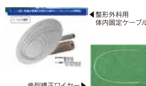
◀整形外科用体内固定ケーブル

マイクロガイドワイヤー、体内固定ケーブル、低侵襲性矯正ワイヤー、人工筋肉ケーブルシステム等の事業化のための施設整備中。