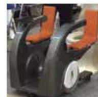
支援ロボットのイメージ▶

一人で乗り込むことを目指した電動式移動支援ロボット・通称介護ロボ(仮称)の量産化のために施設の整備中。