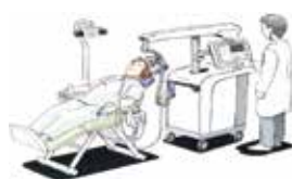
反復磁気刺激装置イメージ▶