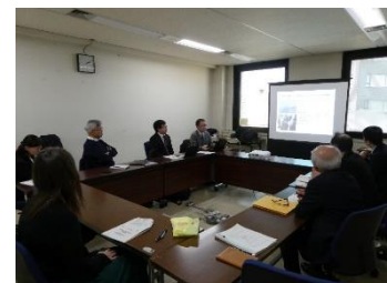
出展者準備会議のイメージ